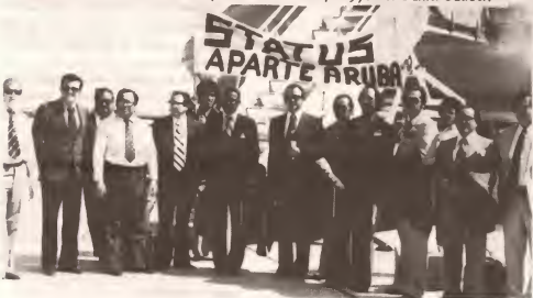
Un delegacion Arubano formal a viaha na 1976 pa Hulanda, Inglaterra y Merca, aki nos ta mira e momento di nan salida pa Europa.